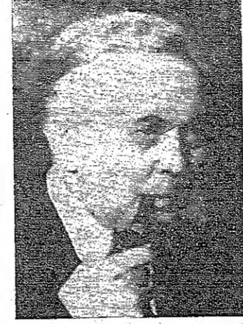
مظاهرة في طوكيو

تطالب ببدء محادثات قمتنام طوكيو - رويتر - نصب مراك حول المسارة الامريكية في طوكيو عندما تظاهر حوالي ٢٠٠ طالب منطريف مطالبين بان تبدأ فوراً مفاوضات السلام المتعثرة بين اسرائيل وجمهورية الصين الشعبية . بعد ان اشبهك وجمبال البوليس مع المظاهرين ، واشترت حوالي ٢٧٥٠ طالب في مسيرات ومهرجانات الامس في طوكيو حول فيتنام . . . . . براغ - رويتر - جلس حوالي خمسة الاف طالب امام سفارة المواليات المتحدة هنا معلنين تضامنهم مع احتجاجات الطلاب في البلدان الاخرى على حرب فيتنام . وانتهت مظاهرة الجلوس بسلام